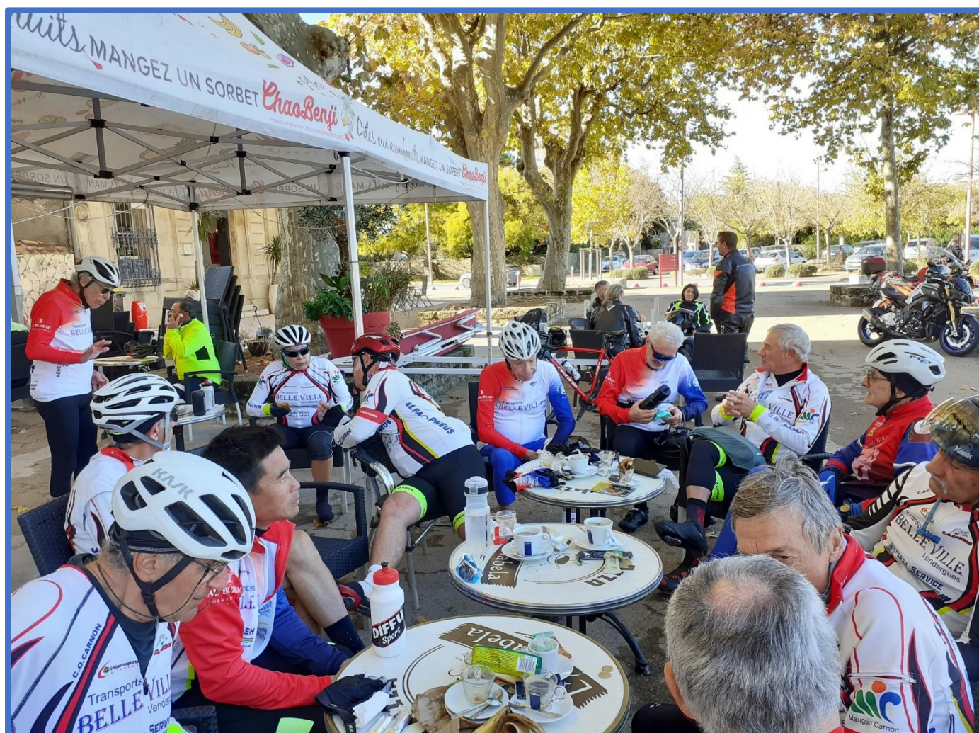
Le Groupe du Petit parcours au Café à Sommières

Sur le grand parcours Monsieur 100 000 Volts a été, selon certains témoignages, un excellent capitaine de route, ne laissant personne à la traîne, même pas les 2CV (réf.sur Whatsapp du G1)