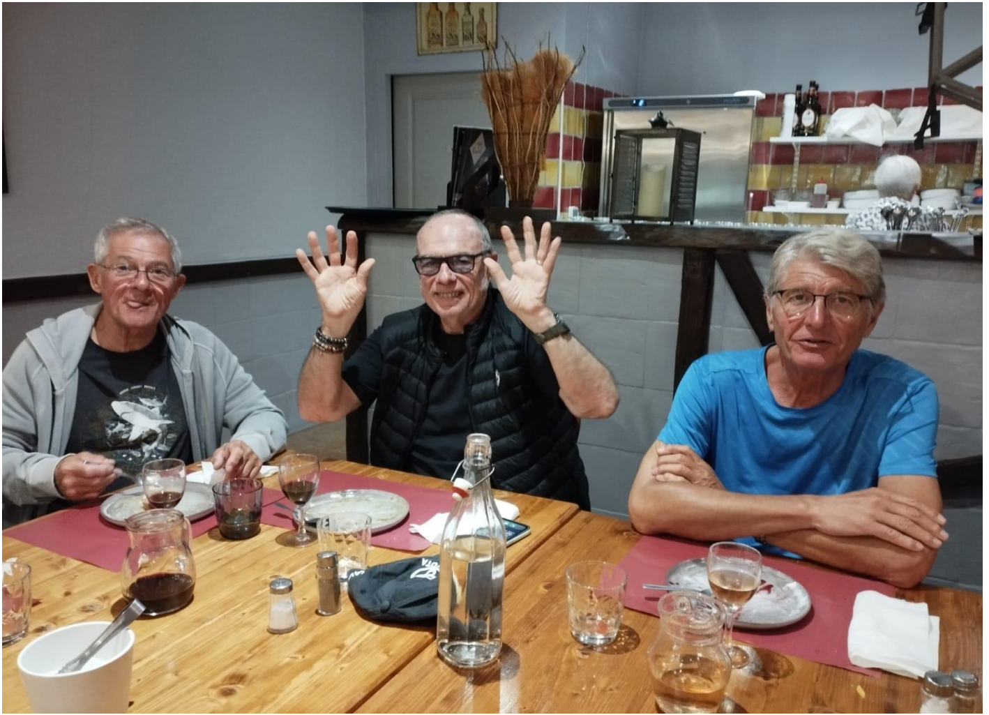
Les Reines du jour