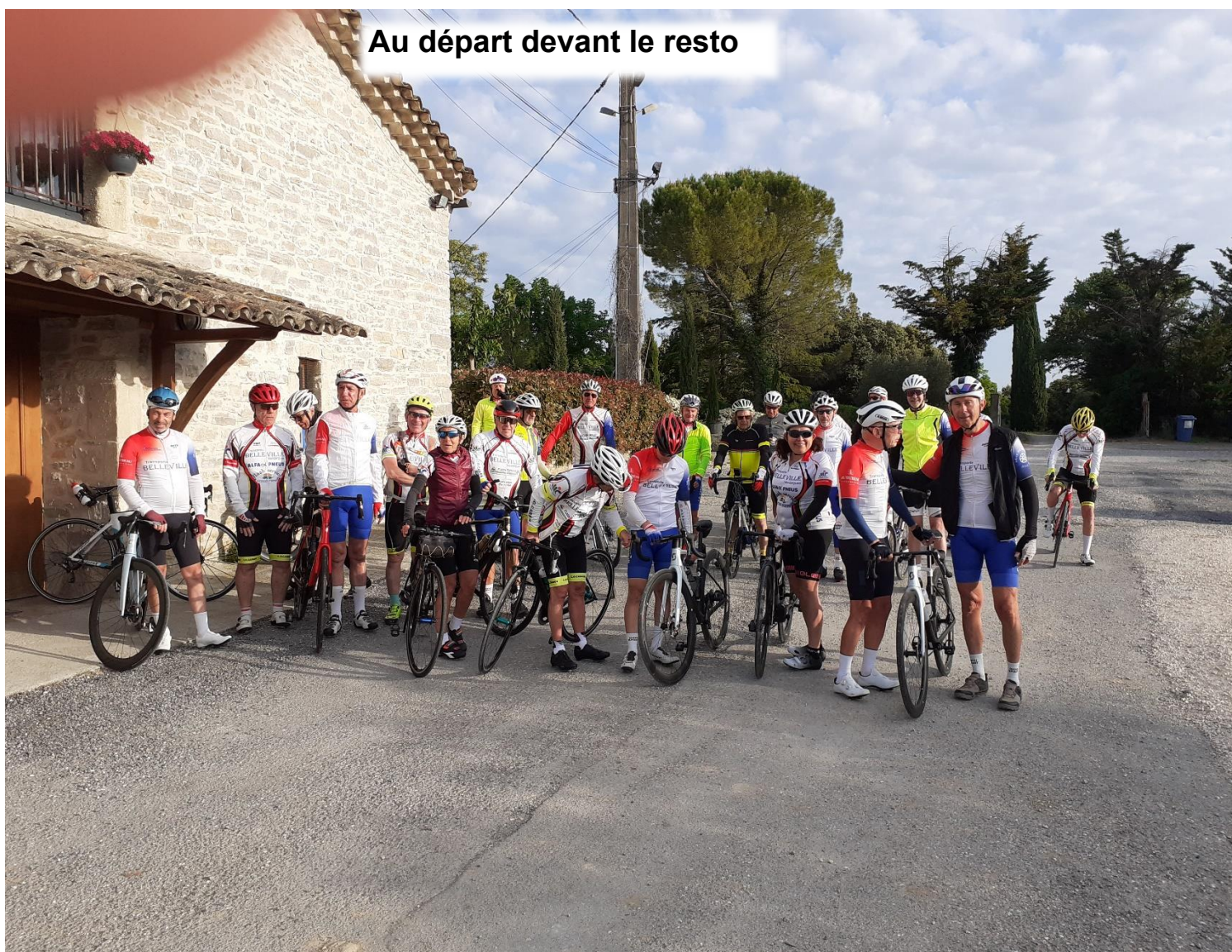
Au départ devant le resto