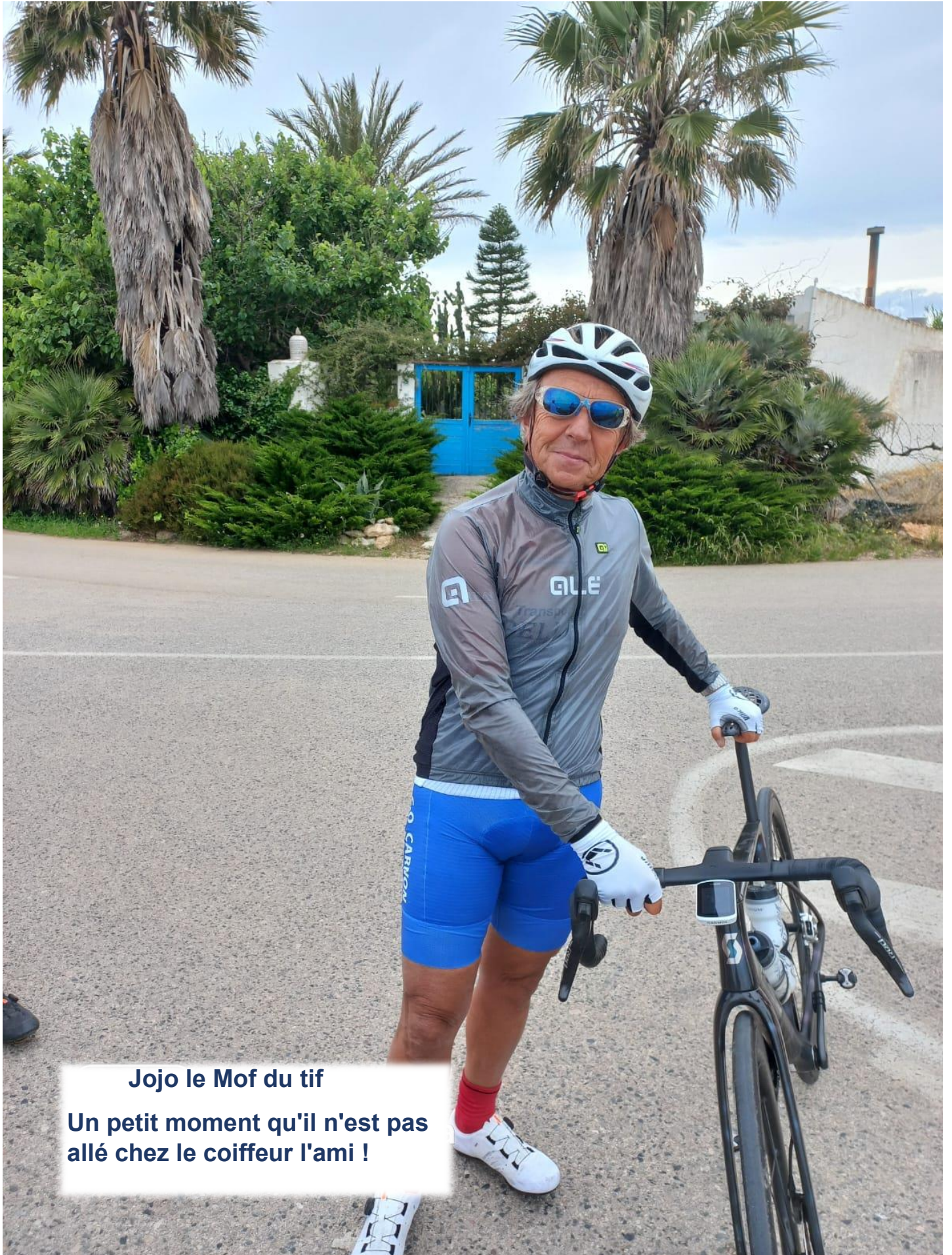
Jojo le Mof du tif Un petit moment qu'il n'est pas allé chez le coiffeur l'ami !