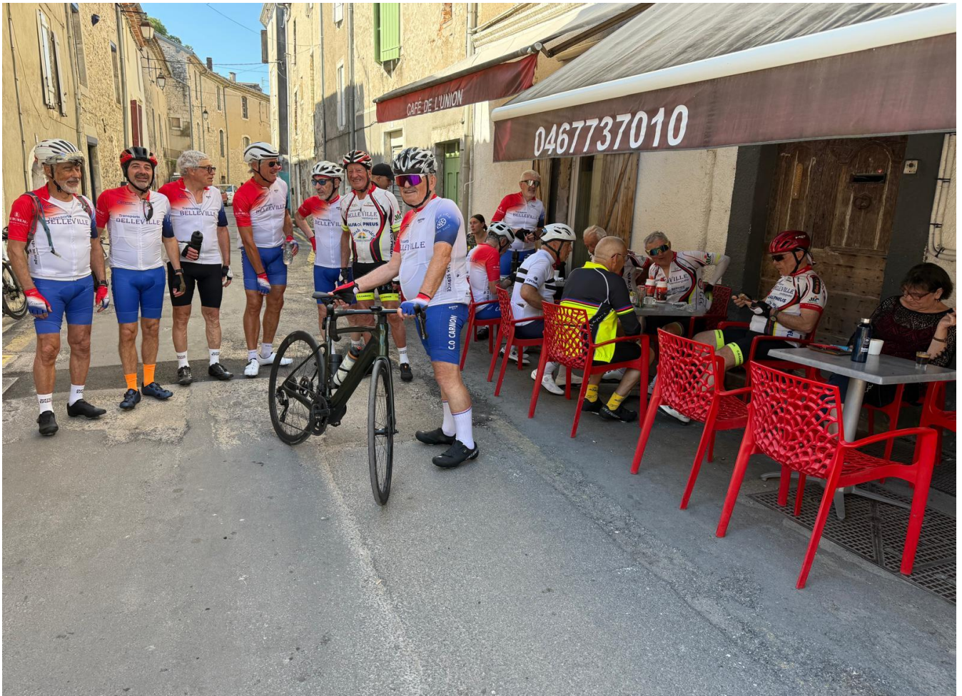
P.S de Jeudi 21 : Photo du G1 à Anduze