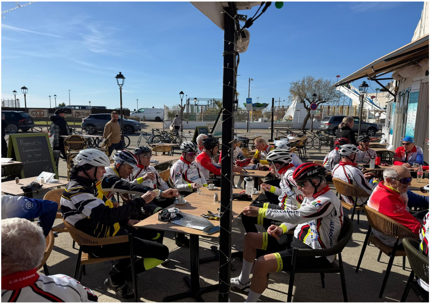
Au repas à St.Laurent d'Aigouze