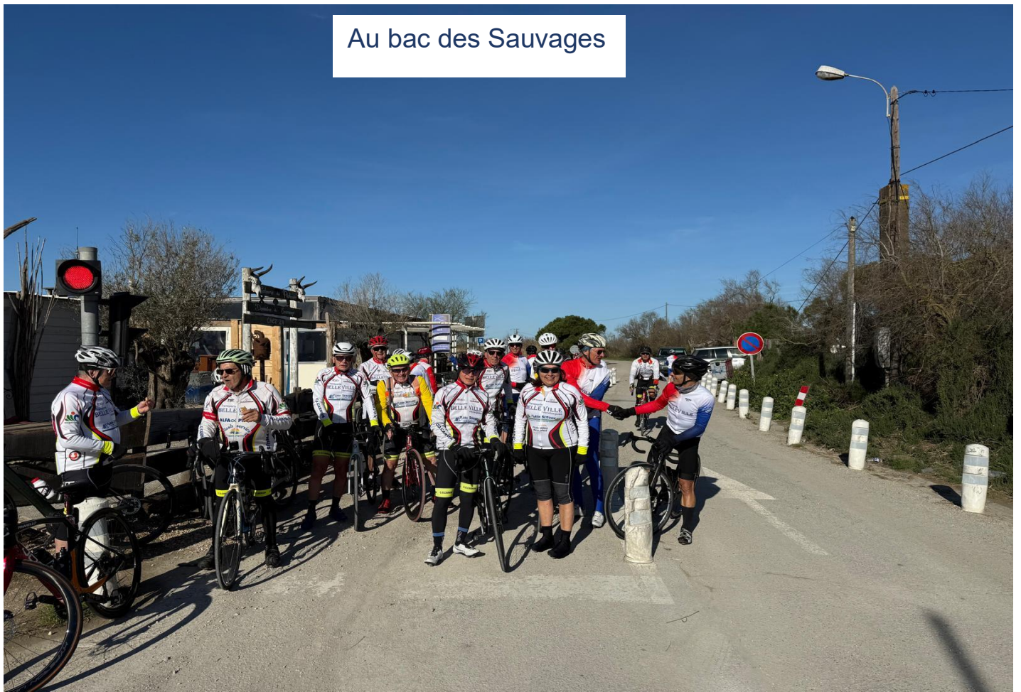
Au bac des Sauvages